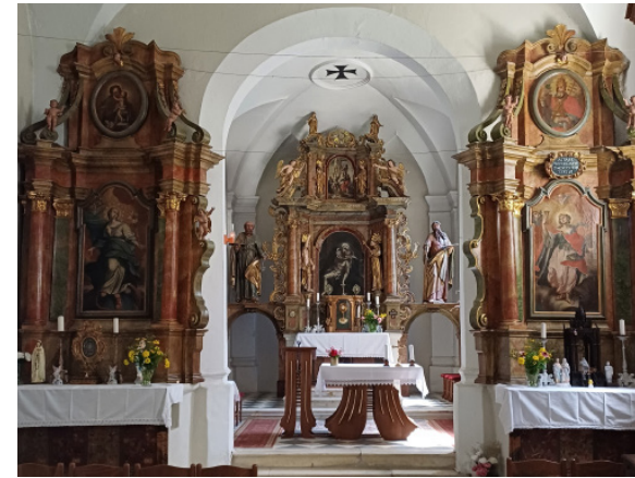
📍 Het kerkje van Jeruzalem van binnen.

dan is een douche of een zwemgelegenheid toch wel erg prettig. We besluiten dan ook, met enige pijn in het hart, dat we de volgende dag weer richting Oostenrijk gaan. In Bad Radkersburg stoppen we voor een wandelingetje en een dikke ijscoupe. Het oude stadje ligt net op de grens. Een passende manier om afscheid te nemen van Slovenië. Klein maar fijn: die beschrijving past volledig bij de streek rondom Jeruzalem. Of je nou wijnliefhebber bent, een sportieve fietser of met de camper op weg naar Kroatië of Hongarije, deze wijnroute mag je eigenlijk niet links laten liggen. 🚐