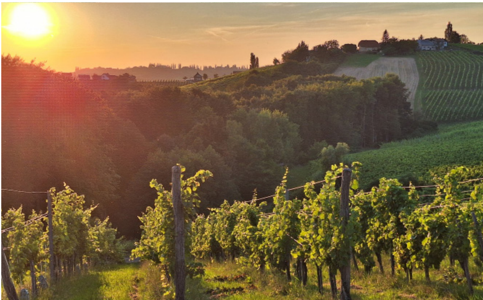
📍 De camper staat pal naast de wijngaard.